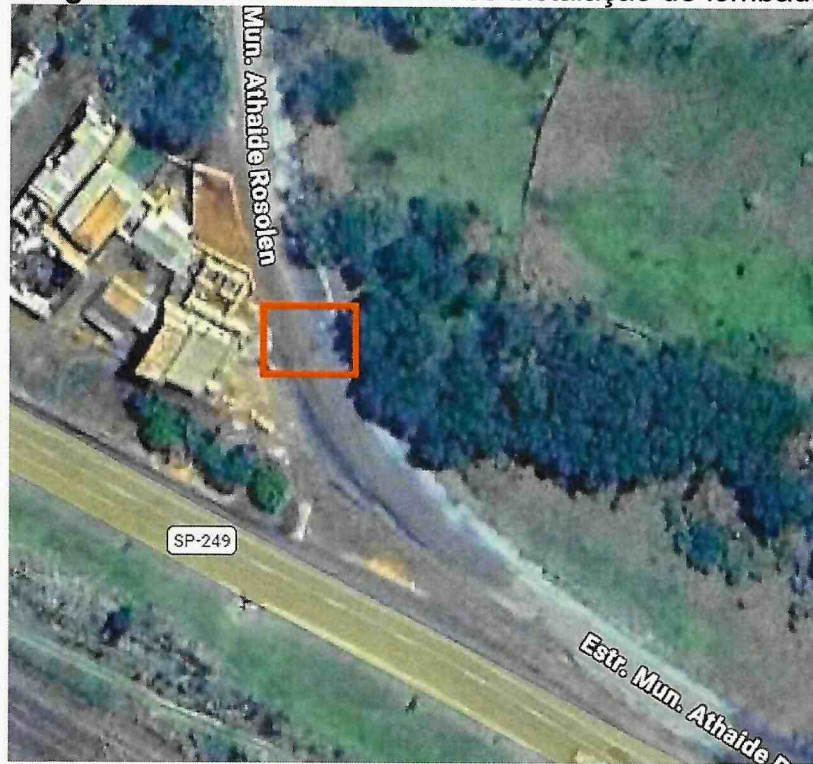
Imagem 1 – Local onde solicita-se instalação de lombada