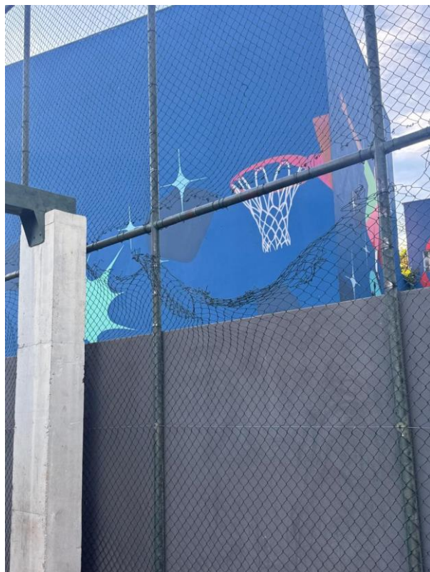
IMAGEM 1 – Fotos das condições atuais dos gols, tabelas da cesta de basquete e telas de proteção